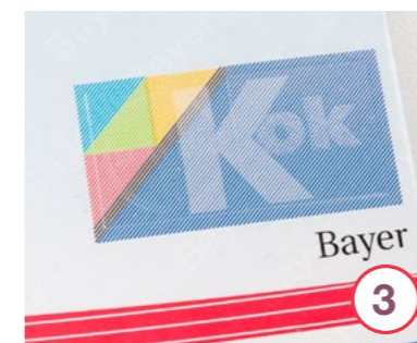
Sicherheitsmerkmale einer Kovaltry®-Packung (weitere Packungsvarianten sind möglich)