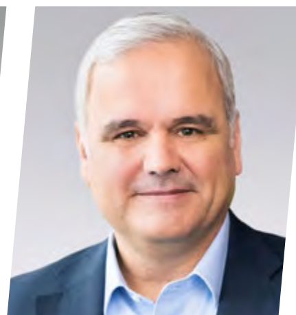
Stefan Oelrich Pharmaceuticals