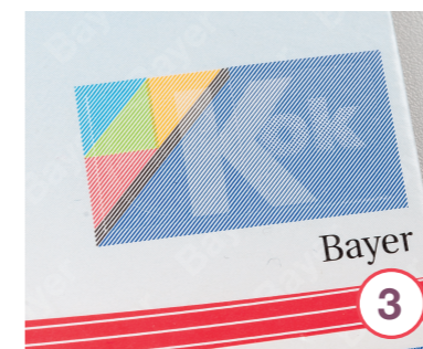
Sicherheitsmerkmale einer Kovaltry®-Packung (weitere Packungsvarianten sind möglich)