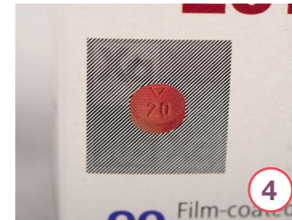
Sicherheitsmerkmale einer Xarelto®-Packung (weitere Packungsvarianten sind möglich)