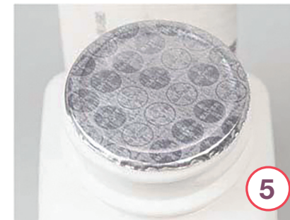
Sicherheitsmerkmale einer Nexavar®-Packung (weitere Packungsvarianten sind möglich)