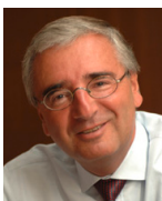
DR. OEC. HSG. PAUL ACHLEITNER