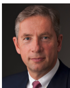
DR. RER. POL. KLAUS KLEINFELD

1980 bis 1986 Studium der Psychologie in Hamburg; 1987 bis 1991 Tätigkeiten bei Reemtsma, u.a. Produktmanager für die Marke „West“; 1991 bis 1996 Tätigkeiten bei Pepsi-Cola, u.a. Marketing Manager, National Sales and Franchise Director und General Manager; 1997 General Manager von Novartis Nutrition für Deutschland und Österreich; 1998 Leitung der Nutrition Division von Novartis; 1998 Mitglied der Gesamtgeschäftsleitung von Novartis; 2000 bis 2007 CEO des Pharmageschäfts von Novartis; 2007 CEO der Division Novartis Consumer Health; seit 2009 Vorsitzender des Vorstands der ProSiebenSat.1 Media AG